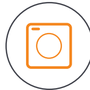
4/3 CMOS Hasselblad-Kamera